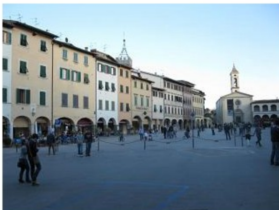
La piazza Ficino di Figline dove si svolgerà il presidio

Dopo il divieto la onlus difende “le rivendicazioni dei cittadini”, ma annuncia comunque l’adesione alla manifestazione “nelle modalità concordate”