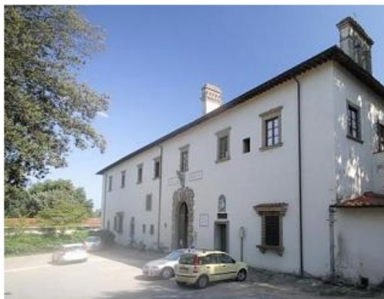
L'ospedale Serristori di Figline

Manifestazione in piazza a sostegno dell'ospedale; presenti anche i rappresentanti di Fratelli d'Italia e della lista civica "Crederci Insieme"