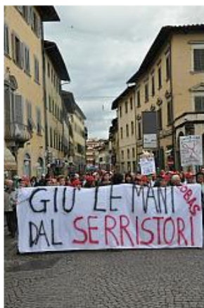
Una recente manifestazione per il Serristori

Una nota ufficiale indica i rappresentanti azzurri che parteciperanno alla manifestazione indetta per venerdì sera a sostegno dell'ospedale di Figline