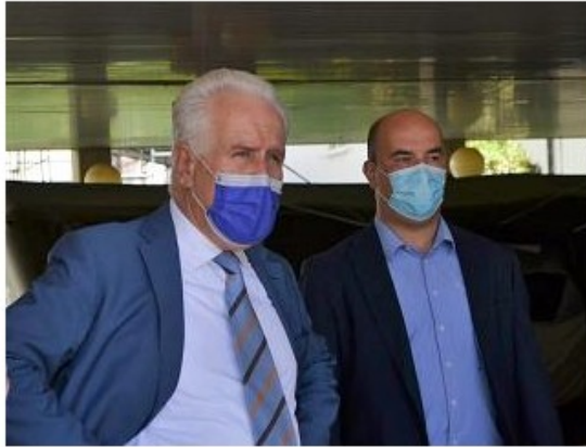
Il presidente Giani e il sindaco Benucci al Serristori