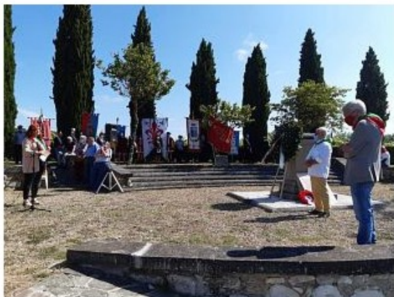
Il ricordo dell'eccidio di Pian d'Albero a Sant'Andrea

Per la prima volta la commemorazione dell'eccidio si è svolta in forma ridotta per evitare assembramenti nel rispetto delle norme contro il contagio