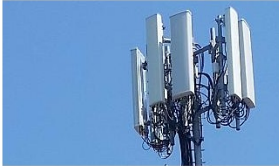
Impianto di trasmissione radio (foto di repertorio)

Dalla maggioranza arriva l'invito all'Amministrazione comunale a dotarsi di strumenti preventivi "per la limitazione, monitoraggio e gestione" del 5G