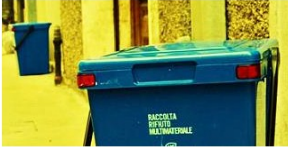
Raccolta rifiuti (foto di repertorio)

L'obiettivo della sperimentazione è quello di avere un minore impatto visivo con il ritiro entro le ore 21. Ecco le strade e le piazze interessate