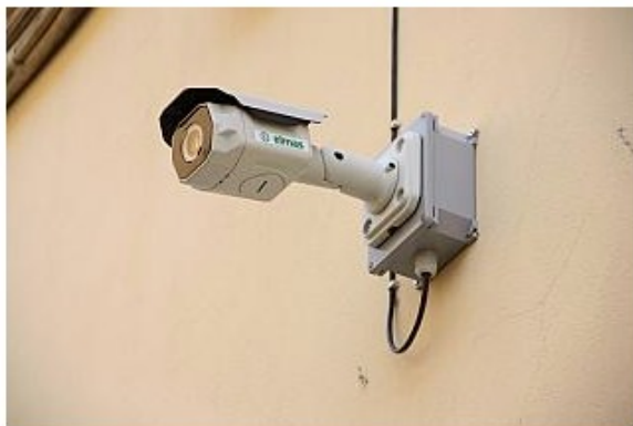
Una telecamera di videosorveglianza (foto di repertorio)

I lavori di installazione degli impianti video riguarderanno Gaville, Poggio alla Croce, Restone e Cesto. I prossimi interventi a Figline e a Burchio