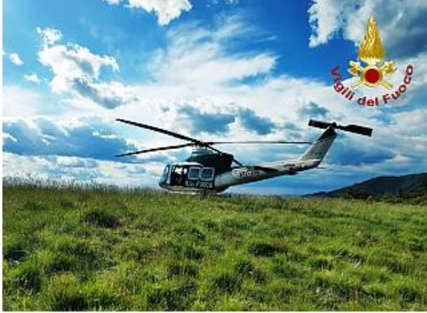
L'elicottero dei Vigili del Fuoco durante il soccorso a Secchieta

Nella zona impervia è risultato impossibile il recupero tramite l'elicottero. I vigili del fuoco di Figline hanno raggiunto a piedi la zona