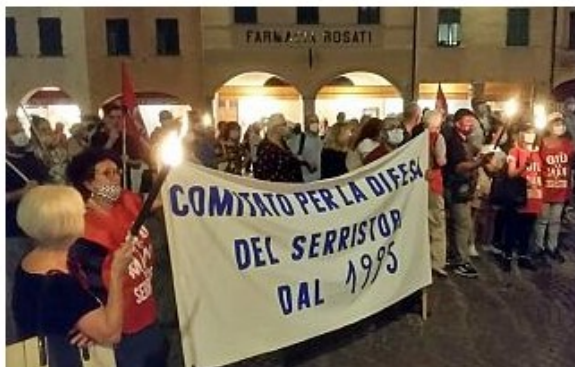
Il Comitato per il Serristori con il suo striscione

Circa cinquecento persone hanno preso parte questa sera all'evento a sostegno dell'ospedale di Figline: "Vogliamo la qualità del servizio"