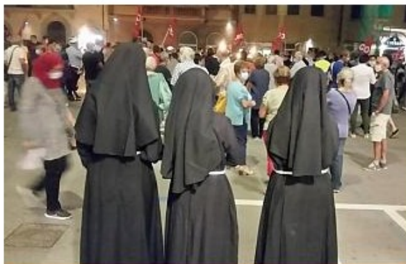
Alcune suore del Serristori alla manifestazione pro-ospedale

La foto-notizia: anche alcune religiose in servizio nel presidio hanno aderito alla manifestazione a sostegno dell'ospedale figline