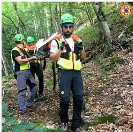
La donna ferita trasportata in barella dal Soccorso Alpino

L'incidente è avvenuto in una zona impervia di Pian di Fornello. La donna è stata trasportata in un luogo più accessibile, creato con le motoseghe