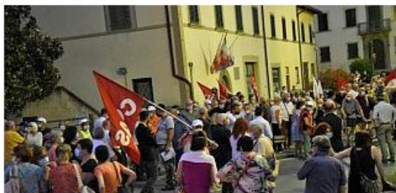
Tante persone in attesa della manifestazione a Figline