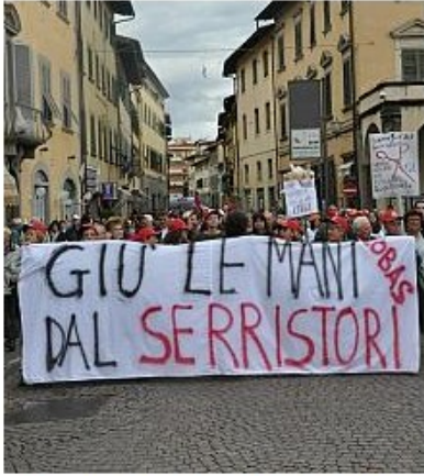
Un recente corteo per il Serristori (foto di repertorio)

Gli organizzatori hanno concordato con le autorità due “presidi statici”; vicino all’ospedale, in piazza XXV Aprile e il successivo in piazza Ficino